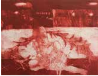
Abb.: Eckhard Froeschlin, Dornröschen, 2017, Radierung